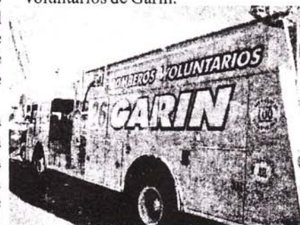
Imponente unidad la G 26

Una verdadera vergüenza por parte de las empresas, que en algún momento a lo largo de su vida, necesitaran de la colaboración de los Bomberos Voluntarios de Garín.