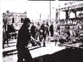
Bautizando la nueva unidad